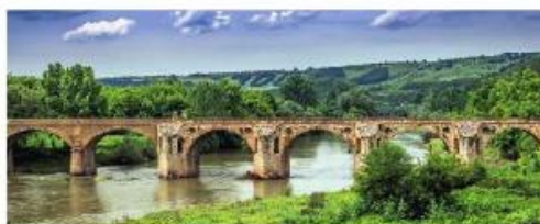
Каменният мост на Колю Фичето при град Бяля