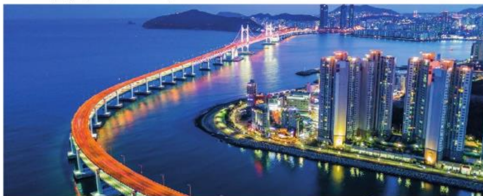
Мост в град Пусан, Южна Корея