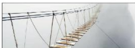
Висящ планински мост

1 Мостовите са сложни съоръжения за преминаване на пешеходци и превозни средства през реки, долини и други. Те имат различна форма и са изработени от различни материали.