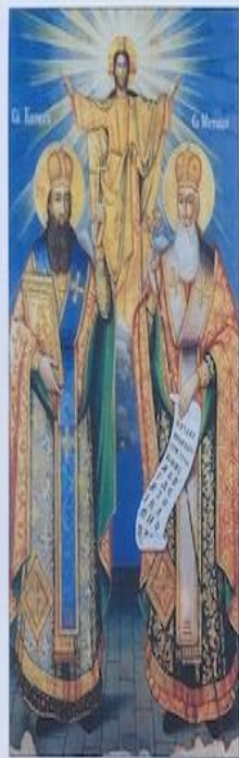
▲ Св. Кирил и Методий, благославяни от Христос. Икона от XIX век. Изглежда странно, че двама представители на византийската аристокрация са създали старобългарската литература и култура. Съставянето на глаголицата и превода на богослужбните книги от гръцки на старобългарски език са били само средство за изпълнение на една висша цел – разпространение на християнството сред езичниците славяни.

Великото дело на братята Кирил и Методий е създаването на славянската писменост и книжовен език, на който били преведени свещените книги на християнството. Славяните, които заселили почти целия Балкански полуостров, говорели на един общ език. Той е наречен от историците „старобългарски език“, защото през VIII-X в. почти всички славяни на полуострова били включени в българската държава и възприели народното име българи. Константин-Кирил Философ владее този език до съвършенство и благодарение на изключителните си знания и способности успял да създаде нова азбука – глаголицата. Старобългарският писател Черноризец Храбър твърди в съчинението си „За буквите“, че това се случило през 855 година. По това време Методий се отказал от светския живот и станал монах в манастир на планината Олимп в Мала Азия. При него отишъл и Константин-Кирил Философ и вероятно още тогава започнал работа по новата азбука. Глаголицата била завършена през 862 г., когато били създадени и първите преводи на старобългарски език.