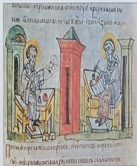
▼ Кирил и Методий съставят азбука и превеждат на славянски език Евангелието – миниатюра от руска хроника от края на XV век. През цялото Средновековие българите вярвали, че създаването на тяхната азбука и книжовен език е дело, вдъхновено от Бога.

Обаче ако запиташ славянските азбукарчета, като речеши: „Кой ви е създал азбуката или превел книгите?“, всички знаят и в отговор ще речат: „Св. Константин Философ, наречен Кирил, той ни създале азбуката и превелe книгите и брат му Методий.“