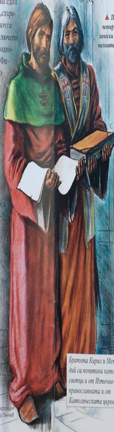
Братята Кирил и Методий са почитани като светци и от Източно-православната и от Католическата църква.