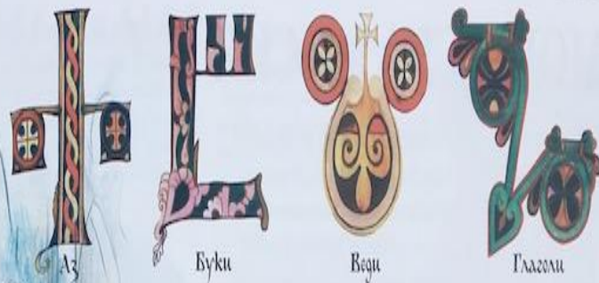
▲ Първите четири глаголически букви и техните имена.