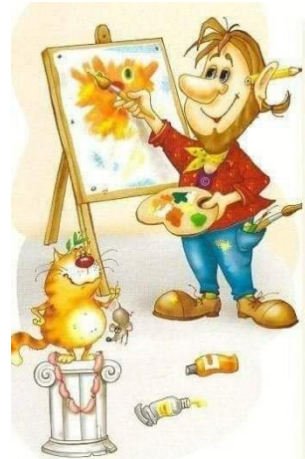
Художникът рисува картина.