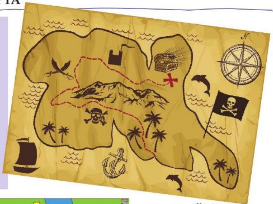
Карта на пиратски остров

Картите представляват умален образ на природни местности и селища. В картите се използват различни видове знаци, които съдържат важна визуална информация . Знаците насочват към важни и интересни места, съобщават за забрани и предупреждават за опасности.