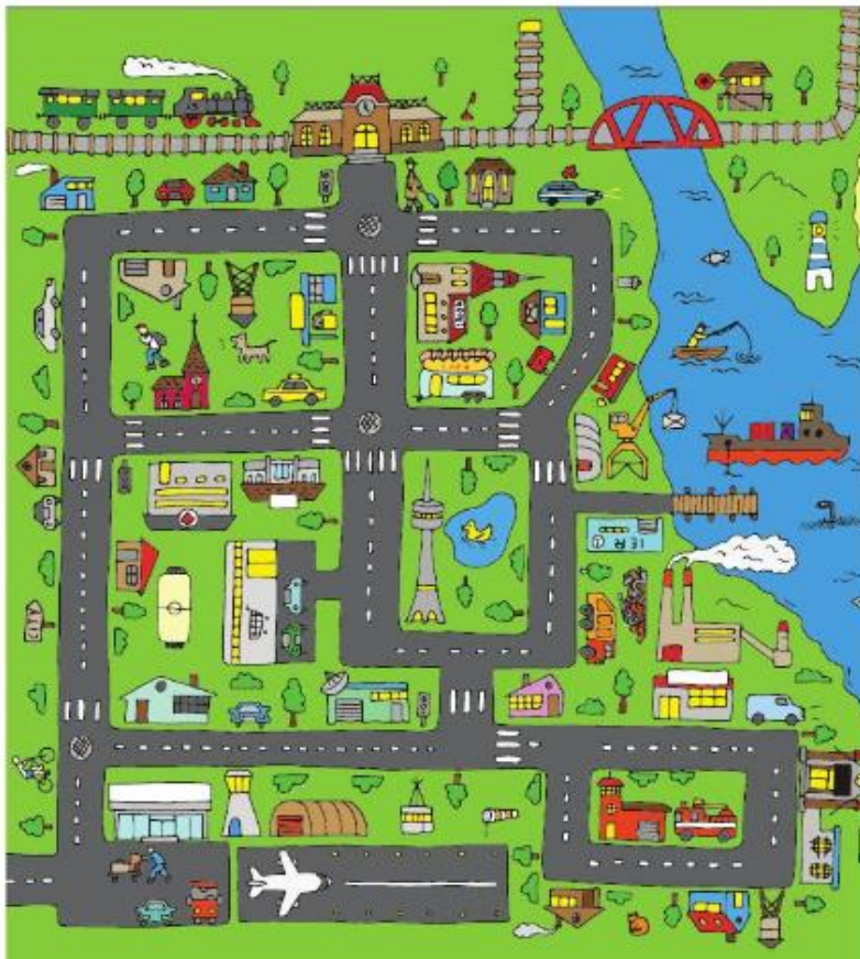
Карта на селище, в която цялата информация е представена с изображения