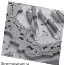
Инструментите за дърворезба се наричат резбарски дъта