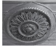
Дърворезбена украса с различни растителни и геометрични орнаменти