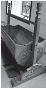
Дървена дъвка с дърворезба, изработена от майстора Петър Вацев